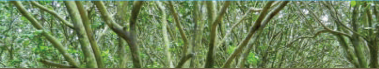
Sau thu hoạch