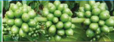
Giữa mùa mưa