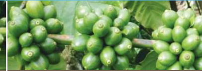
Cuối mùa mưa