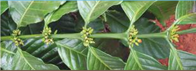
Trong mùa khô