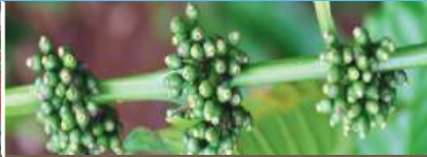
Đầu mùa mưa