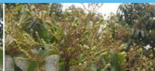
Sau đậu trái