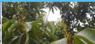
Trước ra hoa