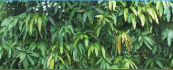
Sau thu hoạch