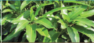
Nhú hoa 5-10 cm