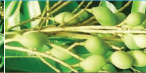
Sau khi bao trái