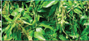
Sau đậu trái